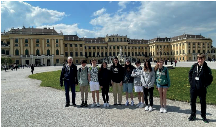
Die Konflklasse vor den Schösser Belvedere und Schönbrunn

Wir erlebten im Wien fünf erlebnisreiche Tage mit einer tollen Gemeinschaft. Wir übernachteten im A&O Hostel nahe dem Hauptbahnhof und erkundigten von dort die Stadt: Die Schösser Belvedere, Hofburg und Schönbrunn, die Karlskirche, den Stephansdom (mit Turmbesteigung) und die